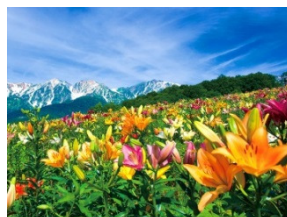
白馬岩岳ゆり園の様子