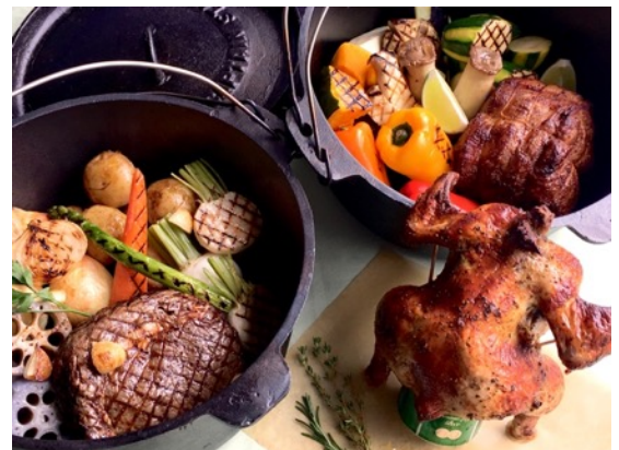
飲食エリア「タバダス」内のバーベキュー

「Xtrem Aventures」は、2001年にフランスで生まれ、全世界15カ国156箇所まで展開されている世界的に人気のアドベンチャー施設です。これまでのアドベンチャー施設にはない、小さなお子様から大人まで安全に遊ぶことができるアクティビティが勢揃いしています。