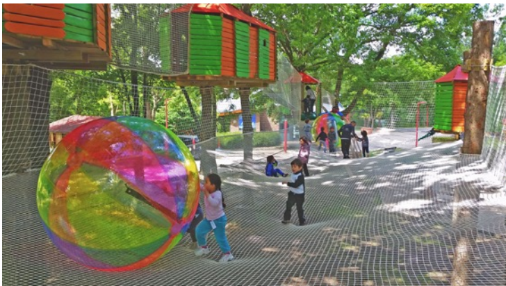
三層式ネット型アクティビティ「アミダス」

※アクティビティ「コギダス」は8月7日（火）より、「トビダス・タワー」は8月23日（木）よりオープンを予定しております。また、今後の状況により早期オープンの可能性があります。詳しくは公式HPをご確認ください。（ https://hakubawow.jp ）