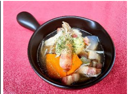
（左から） CHAVATY HAKUBA の「プラムゼリーティーソーダ」、Skyark DECK CAFÉ の「HAKUBA MOON MILK」、Hakuba DELI の「秋の味覚ポトフ」のイメージ