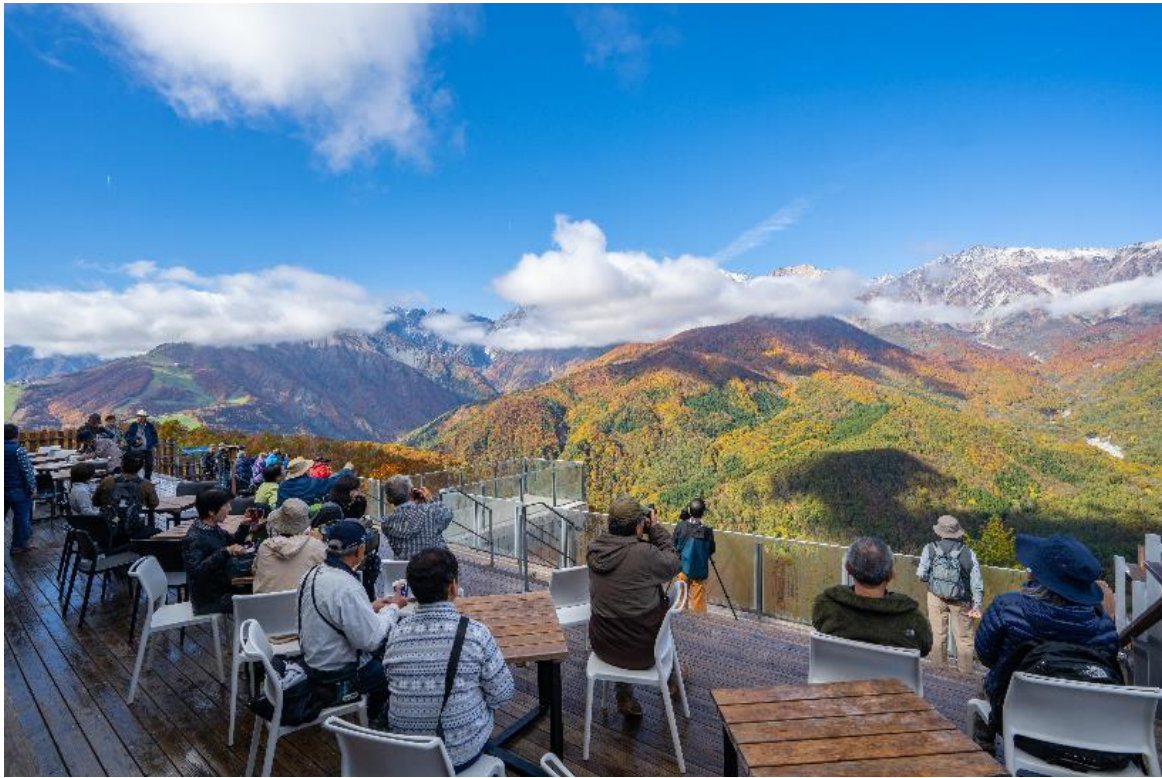
絶景テラス&カフェ「HAKUBA MOUNTAIN HARBOR」から望む紅葉