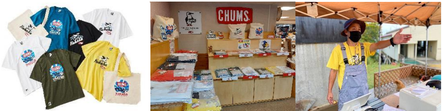
（左から）コラボTシャツとトートバッグ、ノア売店内のコラボ商品コーナー、コラボTシャツをユニフォームとして着用する白馬岩岳マウンテンリゾートのスタッフ

白馬の大自然の環境下で実際にアイテムに触れていただくことで、お客様には使用感や耐久性をお試しいただき、「CHUMS」はお客様の声を今後の商品展開や改善に活用してまいります。