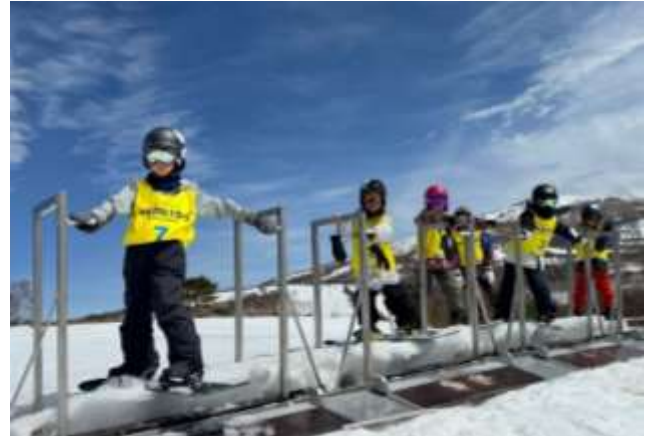
スノーボードキャンプ