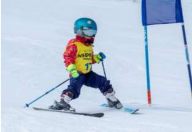
第二回 NSD キッズプログラムスキー・スノーボード大会

お子様が貴重な体験をすることで、より上達を促し、大人になってからもウィンタースポーツに触れ合う環境を提供していきます。