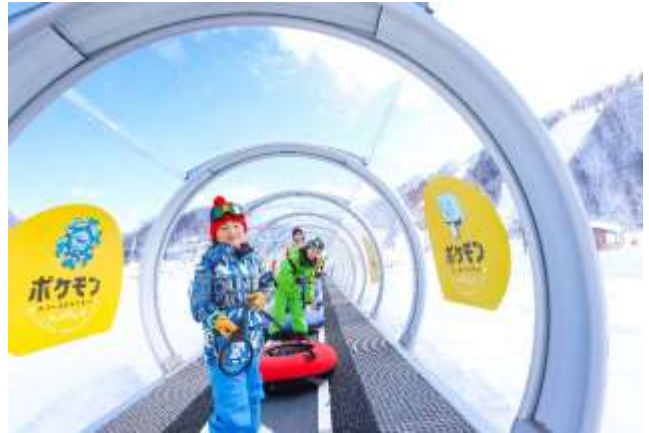
ポケモンスノーアドベンチャー（鹿島槍スキー場 ファミリーパーク）