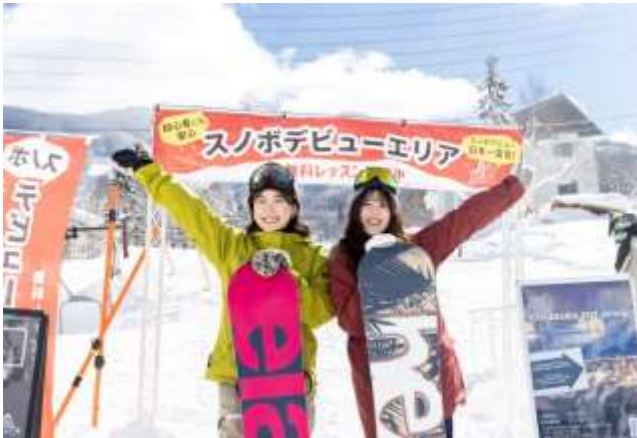
スノボデビューエリア（竜王スキーパーク）