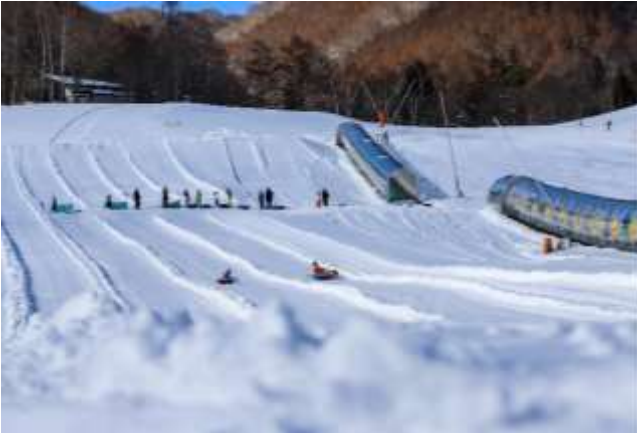
ポケモンスノーアドベンチャー（鹿島槍スキー場 ファミリーパーク）