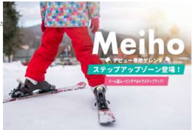
ステップアップゾーン（めいほうスキー場）

NSD では、引き続きウィンタースポーツへの参加のきっかけや再発見になる取り組みにチャレンジしてまいります。