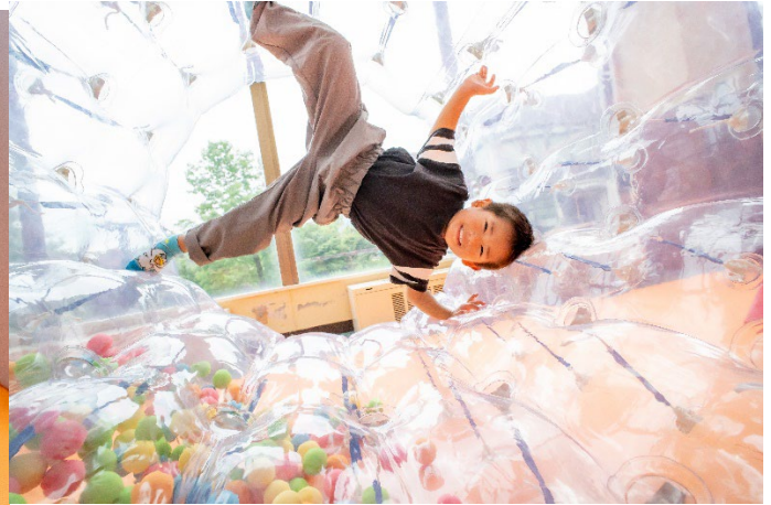
(左)トンネル迷路：(右)サイバーホイール