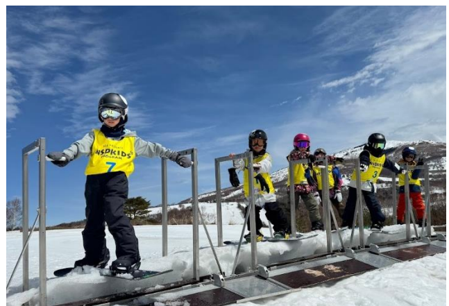
スノーボードキャンプ