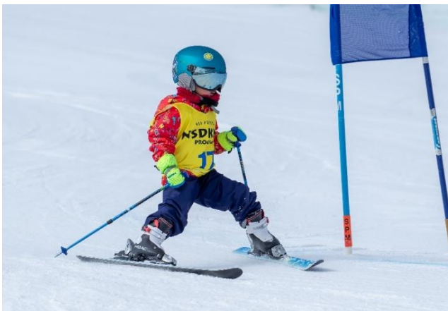
第二回 NSD キッズプログラムスキー・スノーボード大会

さらに 23-24 シーズンからは、お子様の総合滑走能力の向上、及び、心身の成長を目的としたキッズキャンプを実施しています。ご家族様から離れた環境で、お子様だけでキャンプに参加することで、大きな自信につながり、キャンプ終了後には一回り大きく成長したお子様の姿を見ることができます。