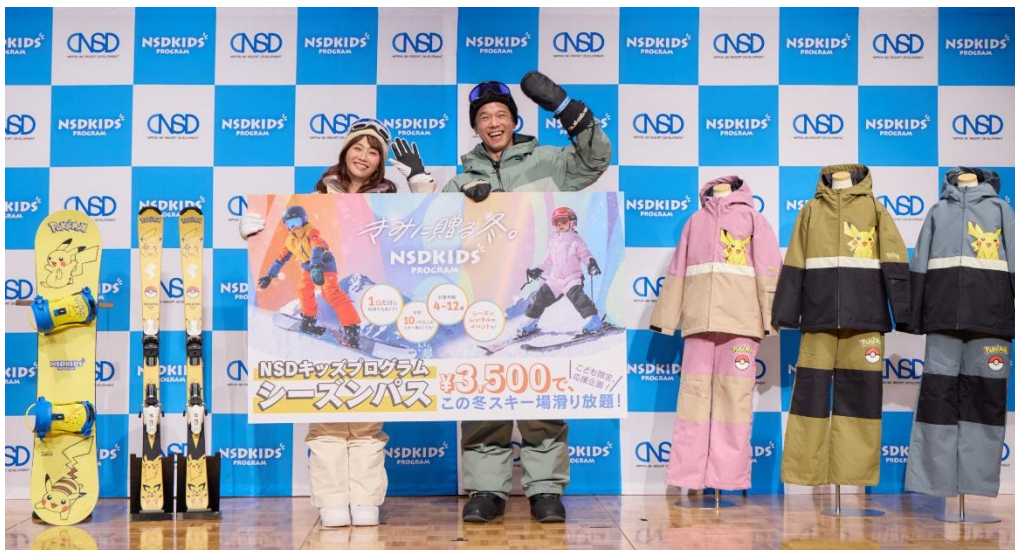
NSD キッズプログラムイベントの様子

2024-2025 シーズンからは新たな取り組みとして 12 月 25 日（水）よりシーズン中も「NSD キッズプログラム」の会員を募集しており、それに際しましてお笑いタレントの庄司智春さん・タレントの藤本美貴さんをお迎えし、スノーリゾート家族旅行の思い出や「NSD キッズプログラム」についてお話しいただきました。