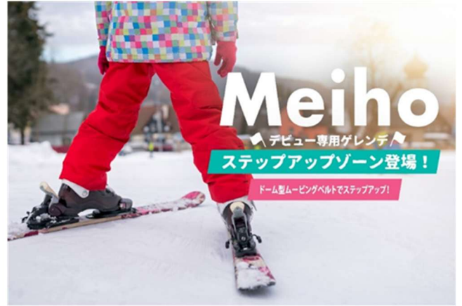
(左) スノボデビューエリア (竜王スキーパーク)、(右) ステップアップゾーン (めいほうスキー場)