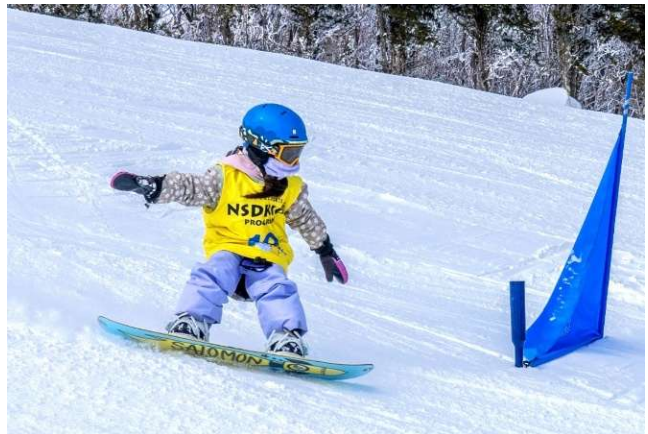
第 3 回 NSD スキースノーボードキッズ大会