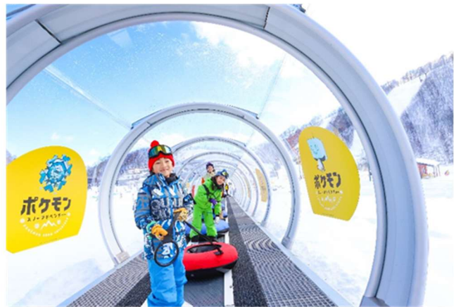
ポケモンスノーアドベンチャー (鹿島槍スキー場 ファミリーパーク)