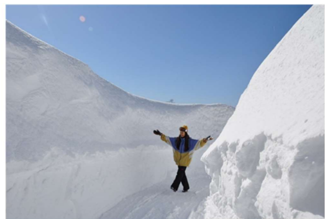
(左) ヤッホー！スウィング (白馬岩岳スノーフィールド)、(右) つがいけスノーウォール (つがいけマウンテンリゾート)