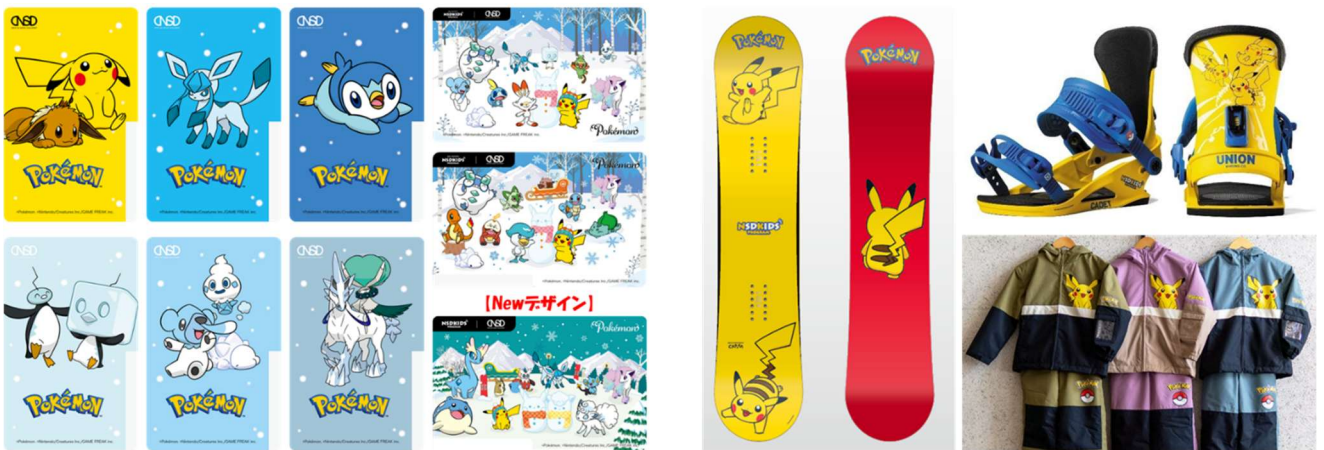
（左）ポケモンデザインのシーズン券、（右）ポケモンデザインのスノーボード、バインディング、ウェア

「子供の成長が早く、毎年サイズが変わるので大変」NSD キッズプログラムでは、そんなお悩みもサポートしています。シーズンを通して同じスキー／スノーボード用品をレンタルすることができ、ポケモンがデザインされた板やバインディング、ウェアをレンタルすることもできます。